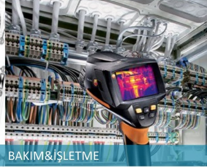
BAKIM & İŞLETME